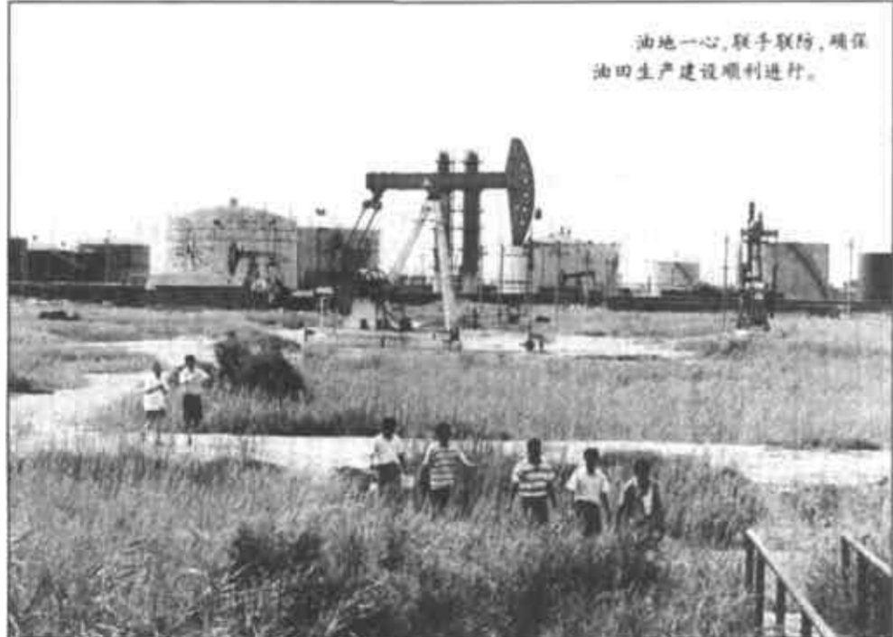
油地一心，联手联防，确保油田生产建设顺利进行。